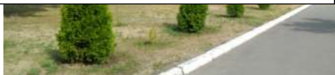
«Дорога в школу» - туи, посаженные выпускниками ГУО» СШ №1 г. Осиповичи им. Б. М. Дмитриева»