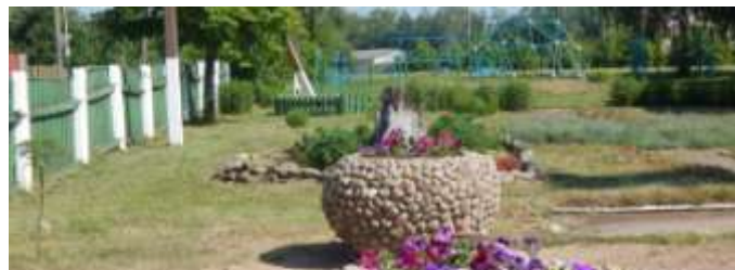
«Книга знаний» ГУО «СШ №4 г. Осиповичи»