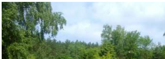
Благоустройство территории ГУО «Гимназия г. Осиповичи»