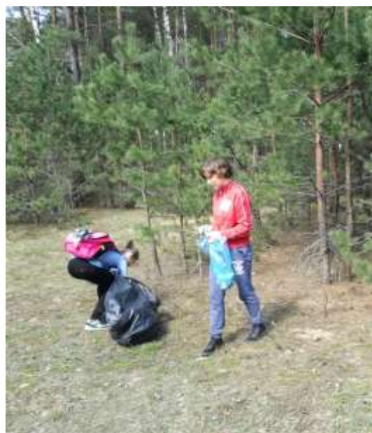
Учащиеся ГУО «ЕлизовскаяСШ» во время проведения акции «Неделя леса»

Уметь понимать и чувствовать живой лес доступно немногим. Это возможно только тогда, когда лес становится призванием и делом всей жизни. И еще, когда тебе с детства помогают сделать первые шаги на этом