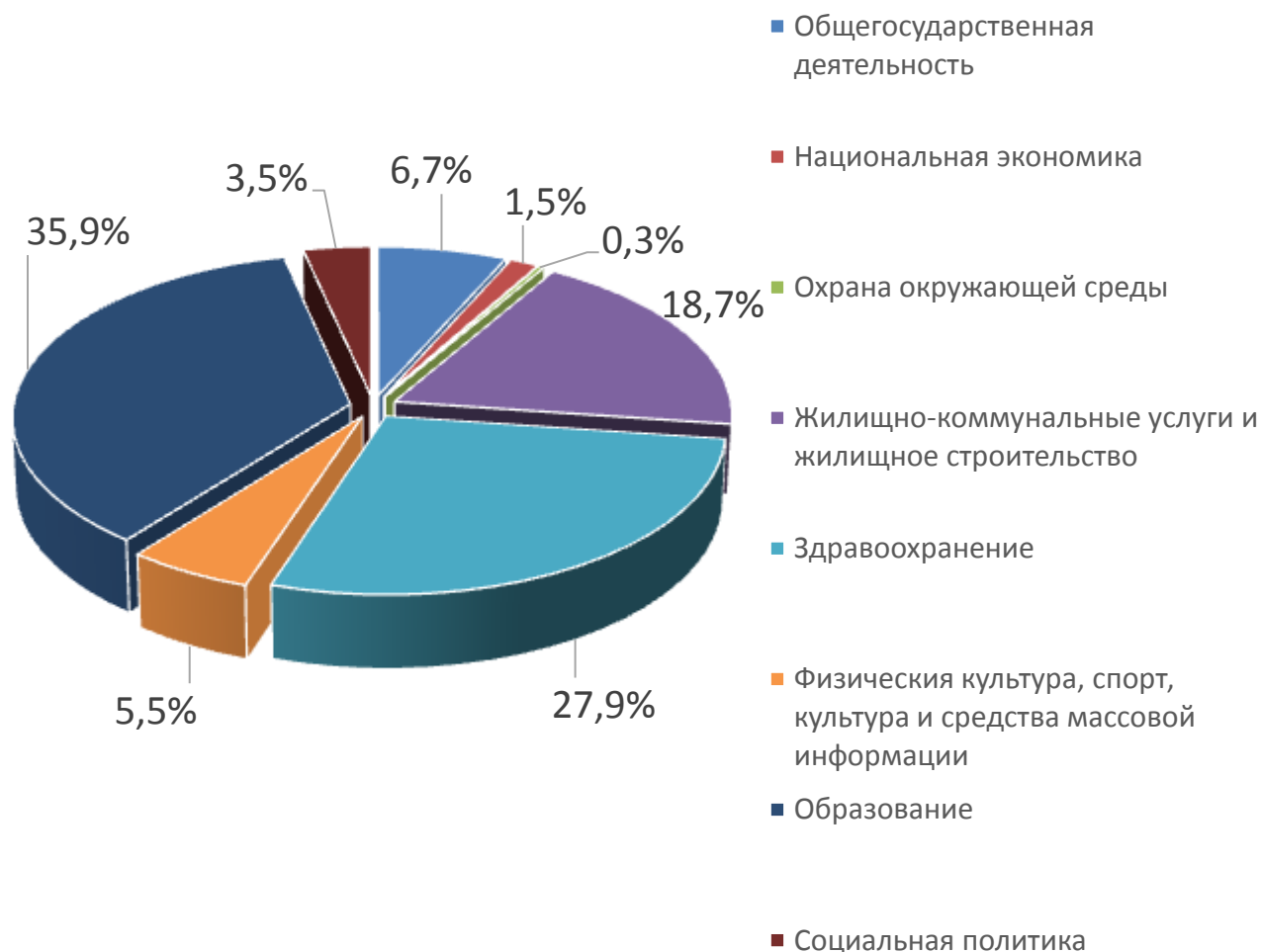
Расходы отраслей консолидированного бюджета Осиповичского района